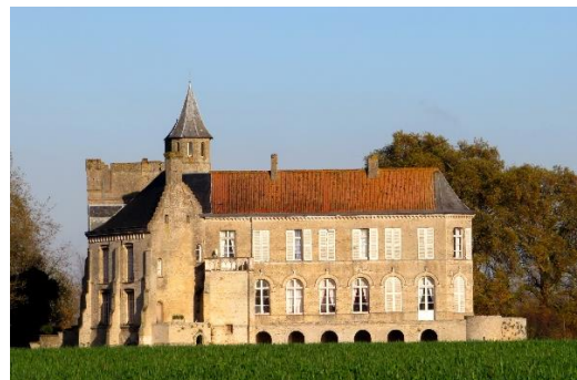
Prachtig voorbeeld van manoir Eeckhout bij Saint-Omer in de Franse Westhoek

Uiteindelijk werden ze tijdens de 19de en 20ste eeuw ook al nagegaapt door de rijk geworden (industriële) burgerij. Philippe Despriet is historicus, archeoloog en schrijver, met specialisatie in de geschiedenis van Frans-Vlaanderen.