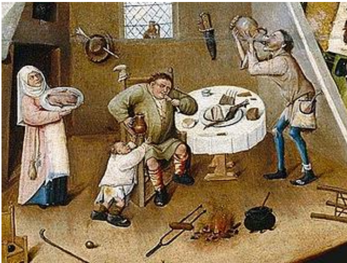
Gulzigheid als detail van De Zeven Hoofdzonden (Jheronimus Bosch)