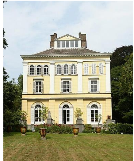
Kasteel van Marke

Tijdens dit bezoek maken we kennis met het archief en de bibliotheek gehuisvest in bijgebouwen van het kasteel. We bezoeken ook de Engelse landschapstuin die het kasteel omringd. (Voor de duidelijkheid: het kasteel zelf kan je niet bezoeken.)